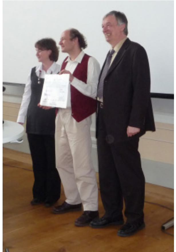
3. Preis: Ökodorf Beetzendorf eG