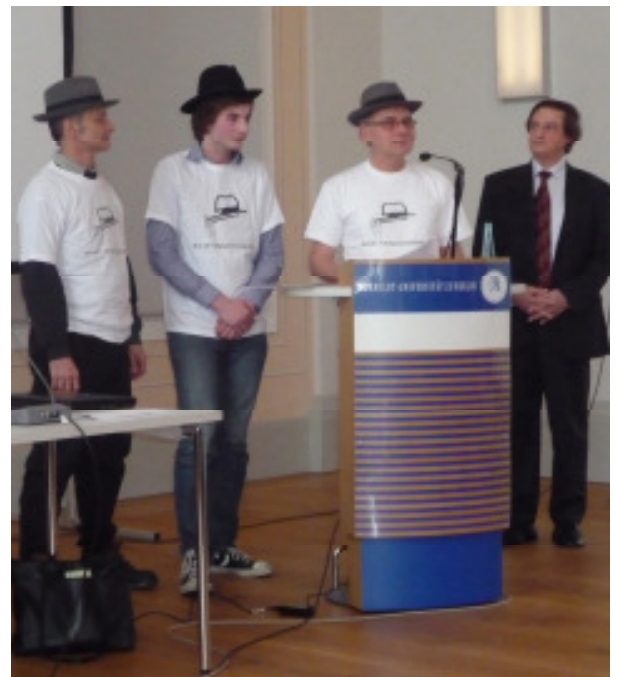
1. Preis: Hut ab! eG in Düsseldorf

Dank fachlicher Unterstützung von Verbänden und Experten und dem Engagement der Akteure an der Schule konnten am Ende alle Widrigkeiten überwunden werden. Heute ist das schon Geschichte. Seit 2004 wirtschaftet die Hut ab! eG und sie tut dies sehr erfolgreich. Sie hat den ersten Preis wahrlich verdient.