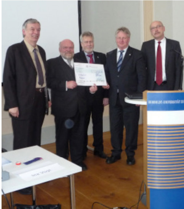
2. Preis: fairKauf eG in Hannover